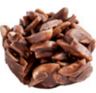
roca de llet