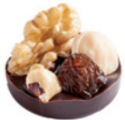
bombó de músic