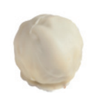
trufat marc de cava